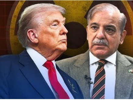
ਅਮਰੀਕਾ ਇੱਕੋ-ਇੱਕ ਅਜਿਹਾ ਦੇਸ਼ ਹੋਵੇ ਜੋ ਪ੍ਰੀਖਣ ਨਾ ਕਰੇ।” ਉਨ੍ਹਾਂ ਦਾ ਦਾਅਵਾ ਹੈ ਕਿ ਇਹ ਦੇਸ਼ ਪ੍ਰੀਖਣ ਬਹੁਤ ਜ਼ਿਆਦਾ

ਜਦੋਂ ਬਾਕੀ ਦੇਸ਼ ਪ੍ਰੀਖਣ ਕਰ ਰਹੇ ਹਨ ਤਾਂ ਅਮਰੀਕਾ ਨੂੰ ਵੀ ਅਜਿਹਾ ਕਰਨਾ ਪਵੇਗਾ। ਉਨ੍ਹਾਂ ਕਿਹਾ, “ਮੈਂ ਨਹੀਂ ਚਾਹੁੰਦਾ ਕਿ