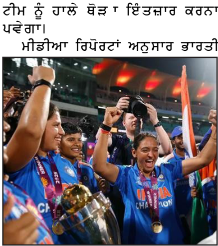
ਕ੍ਰਿਕਟ ਕੰਟਰੋਲ ਬੋਰਡ (2339) ਨੇ ਪੁਸ਼ਟੀ ਕੀਤੀ ਹੈ ਕਿ ਕੋਈ ਜਿੱਤ ਦਾ ਜਲੂਸ ਨਹੀਂ ਹੋਵੇਗਾ। ਜਦੋਂ ਪੁਰਸ਼ ਟੀਮ ਨੇ 11 ਸਾਲਾਂ ਦੇ ਟਰਾਫ਼ੀ ਰਹਿਤ ਸੌਂ ਨੂੰ ਖ਼ਤਮ ਕਰਦੇ

ਮੁੰਬਈ: ਭਾਰਤੀ ਮਹਿਲਾ ਕ੍ਰਿਕਟ ਟੀਮ ਨੇ ਪਹਿਲੀ ਵਾਰ ICC ਮਹਿਲਾ ਵਨਡੇ ਵਿਸ਼ਵ ਕੱਪ ਦਾ ਖ਼ਿਤਾਬ ਆਪਣੇ ਨਾਂ ਕੀਤਾ ਹੈ। ਹਾਲਾਂਕਿ ਉਸ ਇਤਿਹਾਸਕ ਜਿੱਤ ਤੋਂ ਬਾਅਦ ਵਿਕਟਰੀ ਪਰੇਡ ਦਾ ਆਯੋਜਨ ਅਜੇ ਨਹੀਂ ਕੀਤਾ ਜਾਵੇਗਾ। ਰਿਪੋਰਟਾਂ ਅਨੁਸਾਰ ICC ਦੀ ਮੀਟਿੰਗ 7 ਨਵੰਬਰ ਨੂੰ ਦੁਬਈ 'ਚ ਸਮਾਪਤ ਹੋਵੇਗੀ ਅਤੇ ਉਸ ਤੋਂ ਬਾਅਦ ਹੀ BCCI ਦੇ ਸੀਨੀਅਰ ਅਧਿਕਾਰੀ ਭਾਰਤ ਵਾਪਿਸ ਆਉਣਗੇ ਜਿਸ ਦੇ ਚਲਦੇ ਵਿਕਟਰੀ ਪਰੇਡ ਨਹੀਂ ਹੋਵੇਗੀ। ਦੱਸ ਦੇਈਏ ਕਿ ਭਾਰਤੀ ਮਹਿਲਾ ਕ੍ਰਿਕਟ ਟੀਮ ਨੇ ਐਤਵਾਰ ਨੂੰ DY Patil Stadium 'ਚ ਦੱਖਣੀ ਅਫ਼ਰੀਕਾ ਨੂੰ 52 ਦੌੜਾਂ ਨਾਲ ਹਰਾ ਕੇ ਹਰਮਨਪ੍ਰੀਤ ਕੌਰ ਦੀ ਟੀਮ ਨੂੰ ਆਪਣੀ ਪਹਿਲੀ ਵਿਸ਼ਵ ਕੱਪ ਟਰਾਫ਼ੀ ਜਿੱਤ ਲਈ ਸੀ, ਪਰ ਜਸ਼ਨ ਲਈ